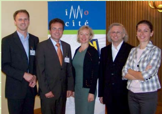
Netzwerktreffen „Ortskern“ 2009

Im Rahmen des Programmes Alpine Space 2007-2013 arbeitet die Stadterneuerung Niederösterreich mit Partnern aus den europäischen Regionen Rhône Alpes, Franche Comté, Lombardia, Bayern und Salzburg in einem Projekt zusammen. Es sind dies die Kammer für Handel und Gewerbe in Lyon, die Stadt Lure, die Generaldirektion für Handel, Messen und Märkte der Region Lombardei, das Bayerische Staatsministerium für Wirtschaft, Infrastruktur, Verkehr und Technologie, die Agentur für Regionalentwicklung in Koper und das Salzburger Institut für Raumordnung und Wohnen. Das Projekt wurde Innocité genannt, da es zum Ziel hat, innovative Ansätze zur Stadtentwicklung im Alpenen Raum im Umfeld von Metropolen anzuregen und zu unterstützen.