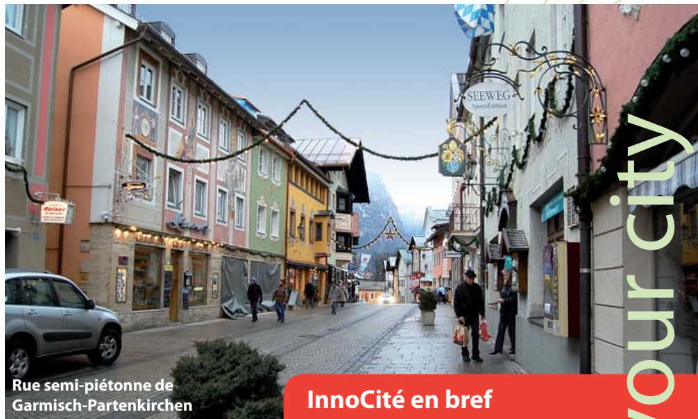
Rue semi-piétonne de Garmisch-Partenkirchen