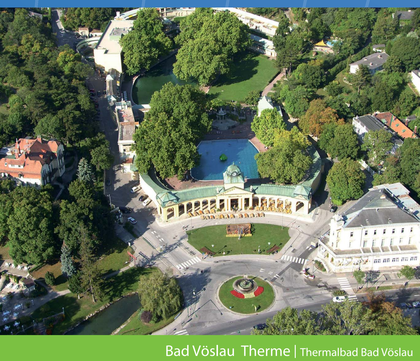
Bad Vöslau Therme | Thermalbad Bad Vöslau