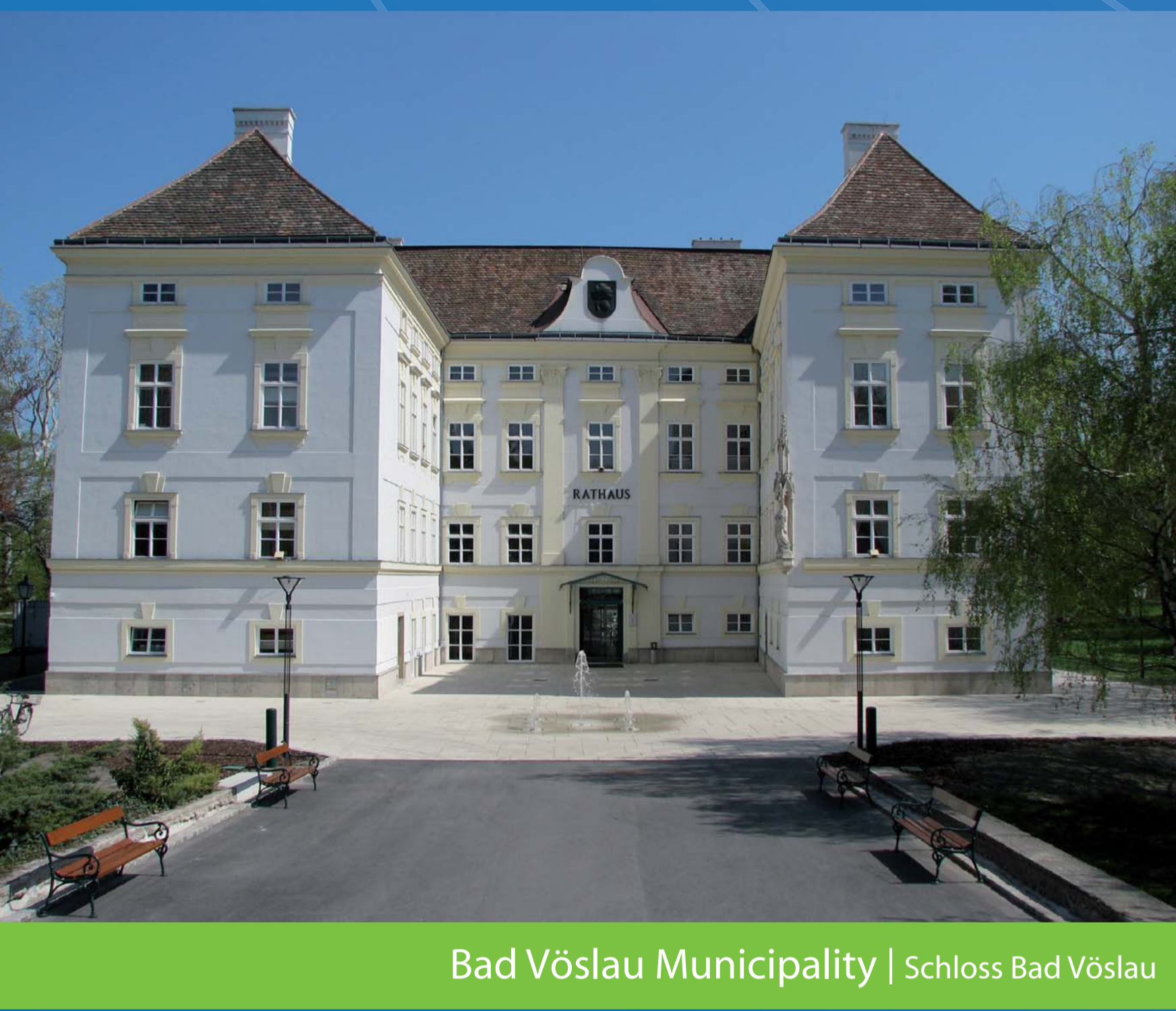
Bad Vöslau Municipality | Schloss Bad Vöslau