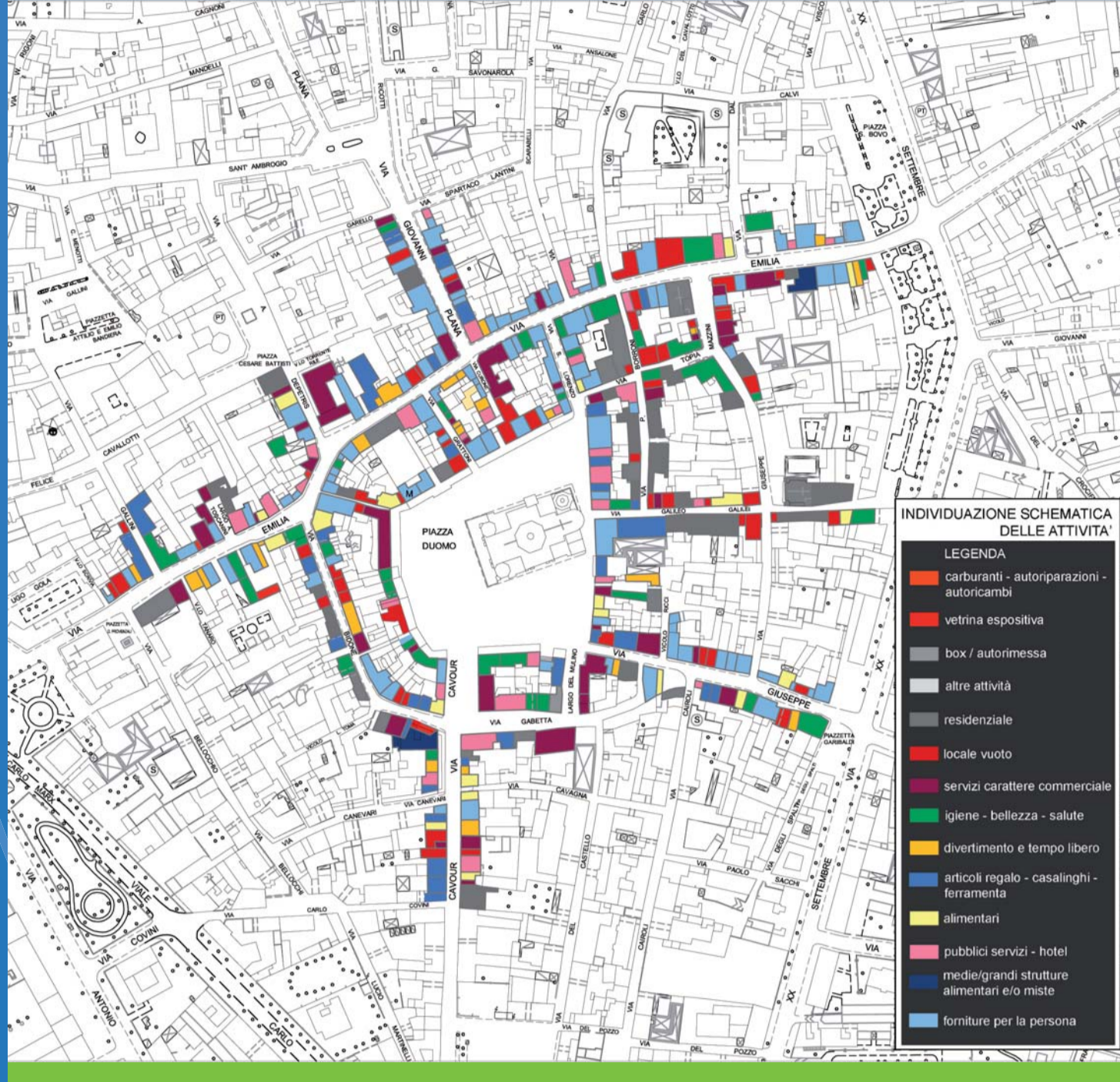
Commercial mix | Mix commerciale