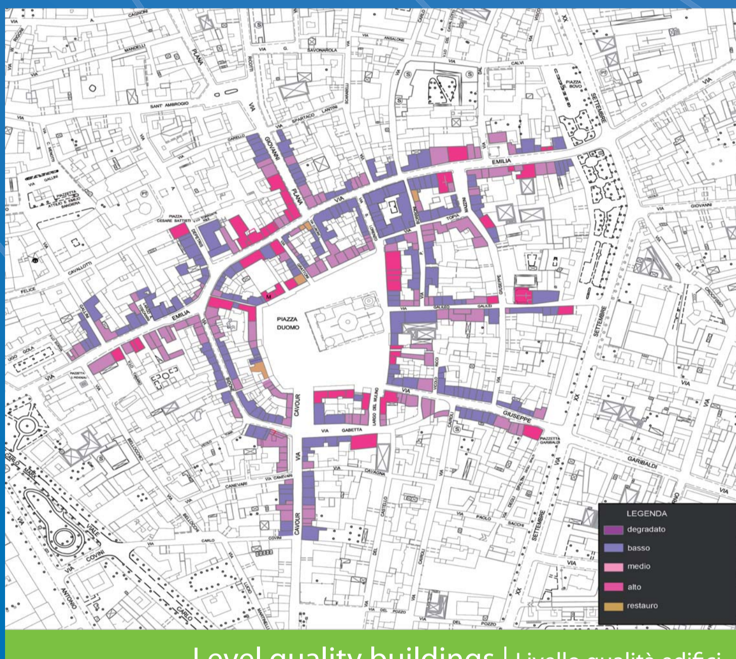
Level quality buildings | Livello qualità edifici