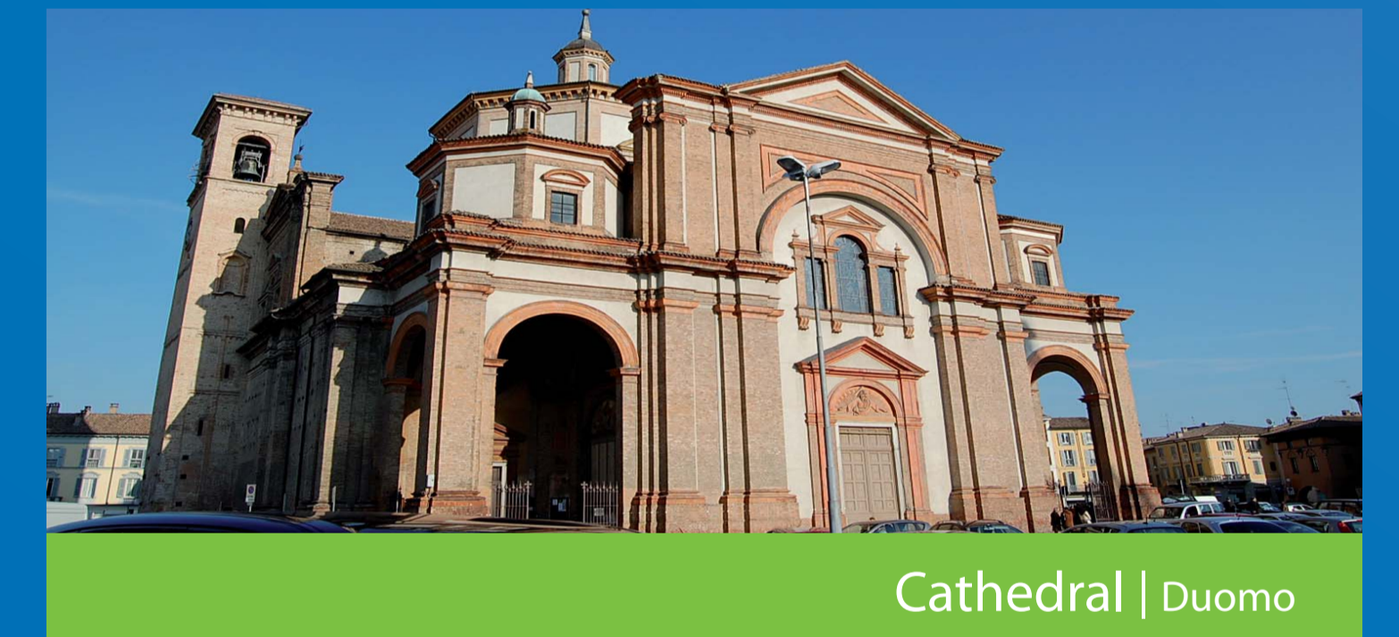
Cathedral | Duomo