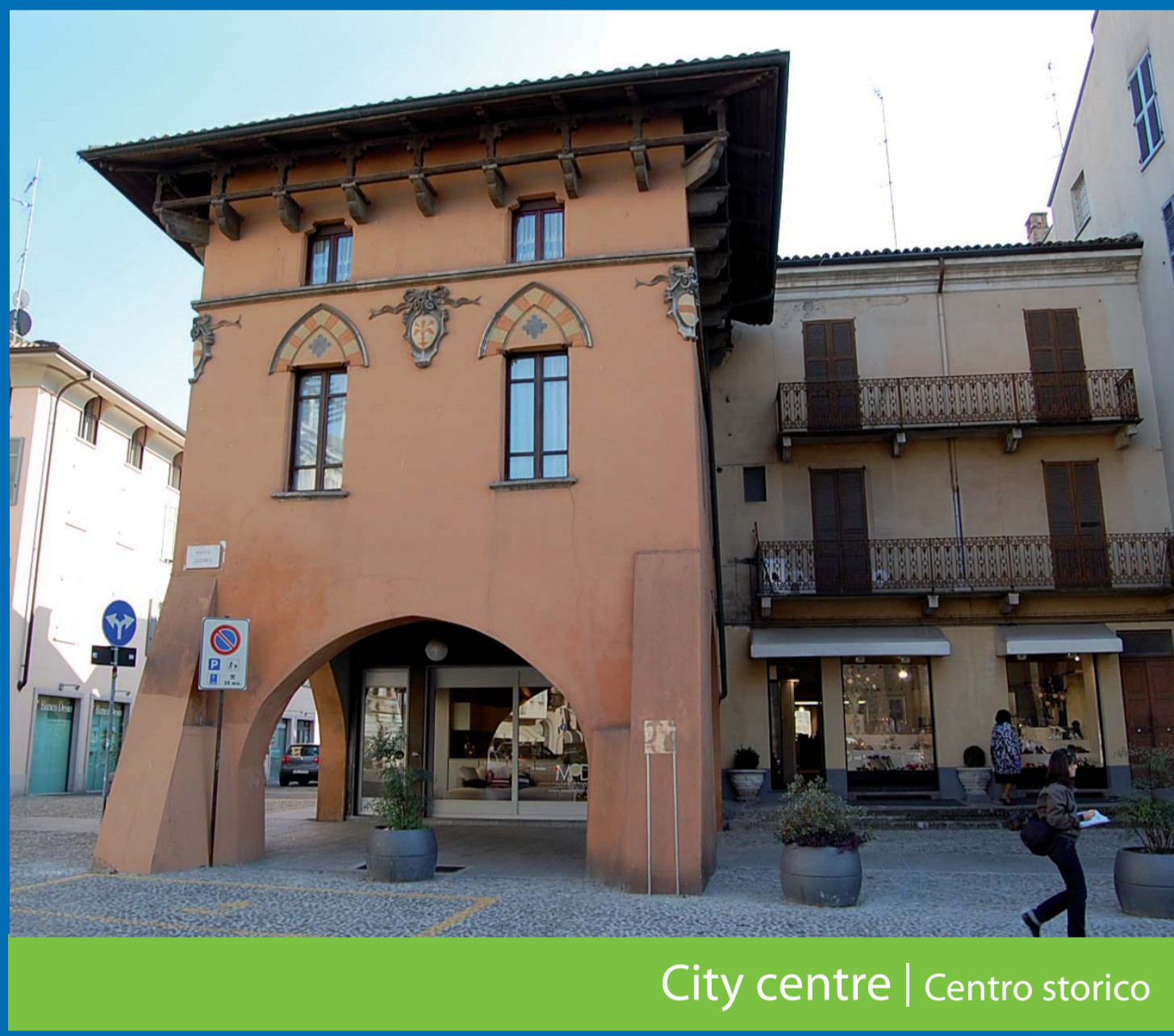
City centre | Centro storico